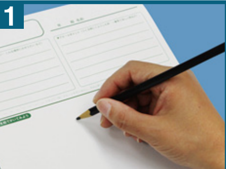
1 プロフィールカードにイメージをかきます。