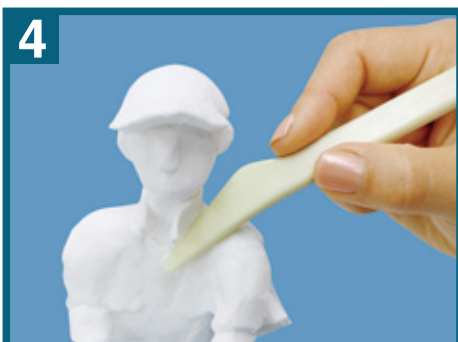
4 靴、ズボン、上着、髪などを具体的に仕上げていきます。