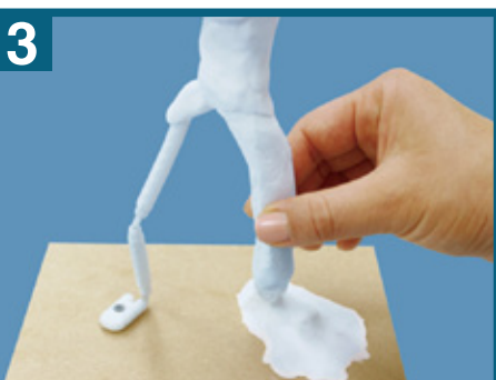
3 台板に近い足からしっかりとねんどを盛りつけます。