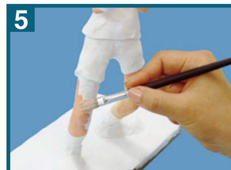
5 ねんど乾燥後、絵の具で着色して完成です。