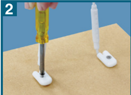
2 プラスドライバーを使ってネジで台板に固定します。